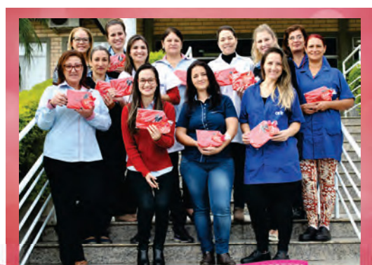
Homenagem Dia das Mães